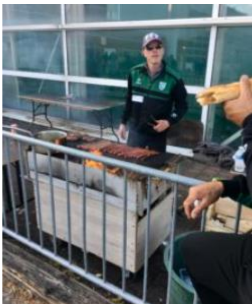
会場の端ではソーセージを焼いている。 結構美味しかった。

テランも日本と変わらず普通の平坦な砂混じりのグラウンド。 ただ、夜中に照明の下でプレーするのは初めてで違和感があったのと、狭いグラウンドに50チーム程がオープンコートでゲームするため、別のゲームのボールが入り乱れ、ボールを見分けるのが大変だった。テランが平坦だから日本のように転がしが多いかということそうでもない。みんなよくティールする。そしてあまり当たらない(これは意外だった)。だけど当たった時は大喜びだ。ルールもあまり厳しくない。ビュットを投げて6メートルに足らなかったのも、移動させるように相手チームに言うと、サークルを後ろにずらせばいいよ、と何度も言われた。クラブハウスのバーには大会事務局があり、試合結果や対戦の組み合わせを管理していたが、4試合終わって結果がどうだったのか何も発表されないし、みんな気にもしないで帰っていった。